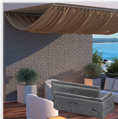
Płytkę elewacyjną cegłopodobną z gotową fugą Boston 1. Zastosowanie: elewacje budynków, elementy dekoracyjne we wnętrzu, ogrodzenia i mała architektura.