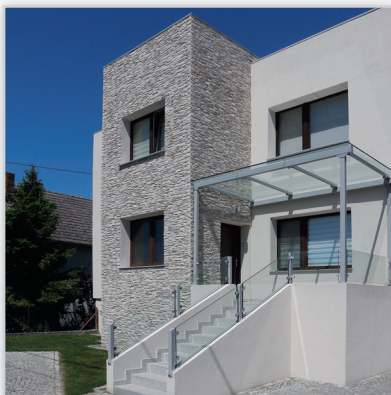
Kamień elewacyjny Nepal 1. Zastosowanie: elewacje budynków, elementy dekoracyjne we wnętrzu, ogrodzenia i mała architektura.