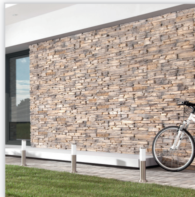
Kamień elewacyjny Grenada 1. Zastosowanie: elewacje budynków, elementy dekoracyjne we wnętrzu, ogrodzenia i mała architektura.