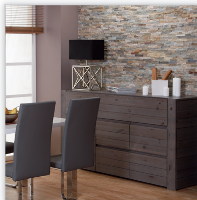
Kamień naturalny ivory. Zastosowanie: elewacje budynków, elementy dekoracyjne we wnętrzu, ogrodzenia i mała architektura.