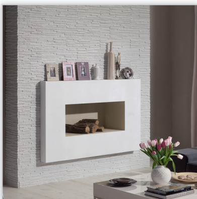
Kamień elewacyjny Palermo 1. Zastosowanie: elewacje budynków, elementy dekoracyjne we wnętrzu, ogrodzenia i mała architektura.