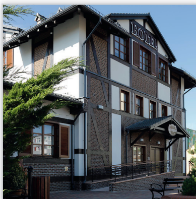
Płytkę elewacyjną cegłopodobną Rustik 568. Zastosowanie: elewacje budynków, elementy dekoracyjne we wnętrzu, ogrodzenia i mała architektura.