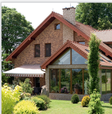
Płytkę elewacyjną cegłopodobną Country 610. Zastosowanie: elewacje budynków, elementy dekoracyjne we wnętrzu, ogrodzenia i mała architektura.